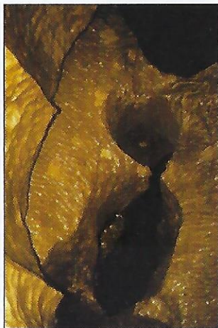
Réseau karstique.

Entre Trépail et Villers-Marmery, le gouffre de la Nau, la fosse de l'Eau lue ou encore le trou Jeannot firent le bonheur des spéléologues. Cette région regorge de grottes et de rivières souterraines ( interdites au public ), royaume des marmites de géants, des stalagmites et des cristaux de calcite. De nombreuses explorations scientifiques, dont celles menées par l'abbé Paramelle, l'un