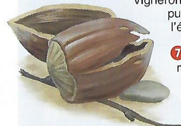
Reliefs de repas de l'écureuil. Dessin P.R.

7 Tourner à gauche. À la mairie, poursuivre par la rue de Germaine, puis rejoindre à gauche la rue des Charmières jusqu'à l'orée du bois.